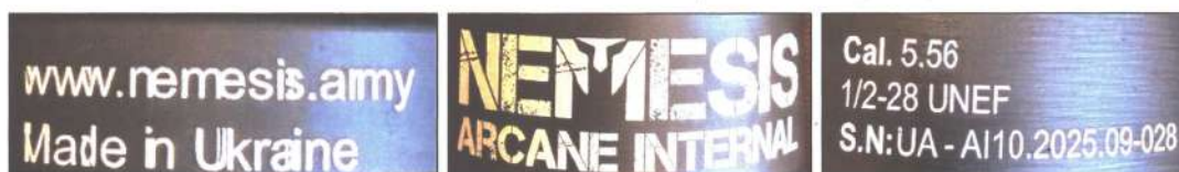
Зображення 2-4. Маркувальні позначення на глушнику звуку пострілу (саундмодератор) NEMESIS ARCANES INTERNAL.

На глушнику звуку пострілу (саундмодераторі) є наступні маркувальні позначення (зобр. 2-4): « www.nemesis.army Made in Ukraine NEMESIS ARCANES INTERNAL Cal.5.56 1/2-28 UNEF S.N: UA-A/10.2025.09-028» - сайт виробника, країна виробник, виробник, модель, калібр, номер.