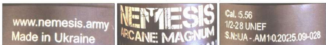
Зображення 6-8. Маркувальні позначення на глушнику звуку пострілу (саундмодератор) NEMESIS ARCANE MAGNUM.

На глушнику звуку пострілу (саундмодераторі) є наступні маркувальні позначення (зобр. 6-8): «www.nemesis.army Made in Ukraine NEMESIS ARCANE MAGNUM Cal.5.56 1/2-28 UNEF S.N: UA-AM10.2025.09-028» - сайт виробника, країна виробник, виробник, модель, калібр, номер.